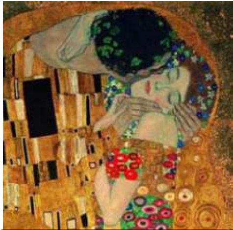
G. KLIMT, Il bacio , 1907-08