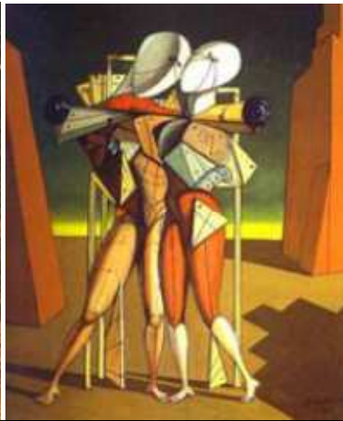
G. DE CHIRICO, Ettore e Andromaca , 1917